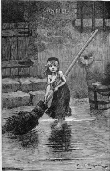
Emile Bayard (1837-1891)